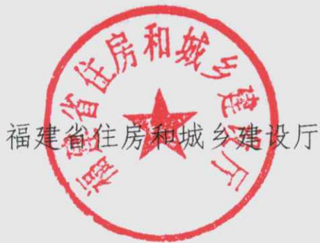
福建省住房和城乡建设厅