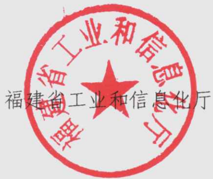
福建省工业和信息化厅