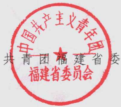
共青团福建省委员会