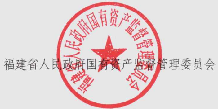
福建省人民政府国有资产监督管理委员会