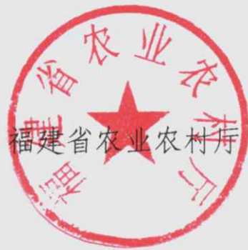
福建省农业农村厅