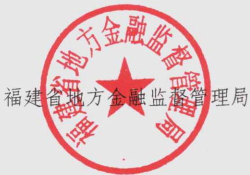
福建省地方金融监督管理局