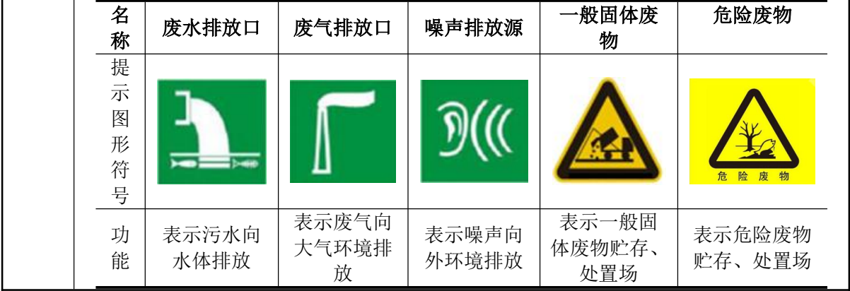
表 4-23 各排污口（源）标志牌设置示意图