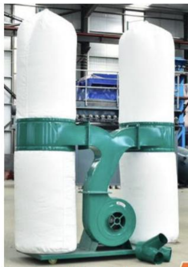
本项目拟使用除尘器样式

袋式除尘器是含尘气体通过滤袋滤去粉尘粒子的分离捕集装置，是过滤式除尘器的一种，待净化的气体通过袋式除尘器时，粉尘颗粒被滤层捕集留在滤料层中，得到净化的气体。袋式除尘器净化效率高，对含微米或亚微米数量级的粉尘效率可达 90~99%；袋式除尘器可捕集多种干性粉尘，特别是高比电阻粉尘采用袋式除尘器净化要比用电除尘器净化效率高很多；含尘气体浓度在相当大的范围内变化对袋式除尘器的除尘效率和阻力影响不大；袋式除尘器可设计制造出适应不同气量的含尘气体的要求，除尘器的处理烟气量适用范围广。袋式除尘器运行稳定可靠，操作维护简单。