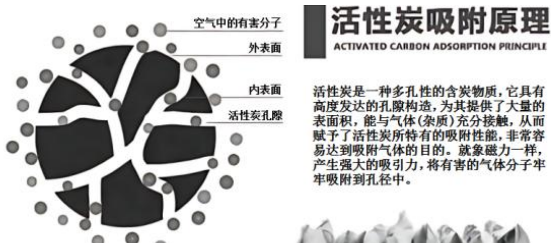
图 4.1-2 活性炭吸附原理图